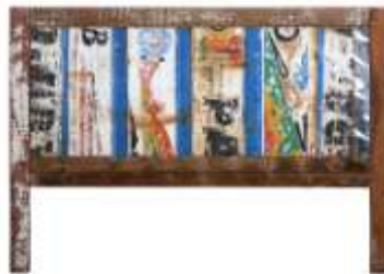
TÊTE DE LIT PIKINE