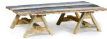
DESSUS AVEC TRETEAU