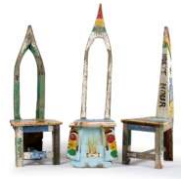
CHAISE AVEC DOSSIER POINTU